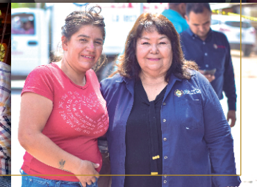
Más cerca de nuestra gente en los "Sábados Ciudadanos"